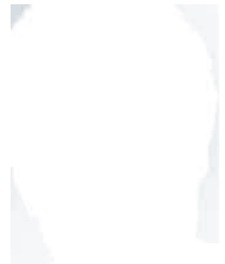
RA Dr. K. Jan Schiffer www.schiffer.de